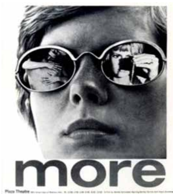
Figura 1. Cartells de pel·lícules sobre Eivissa