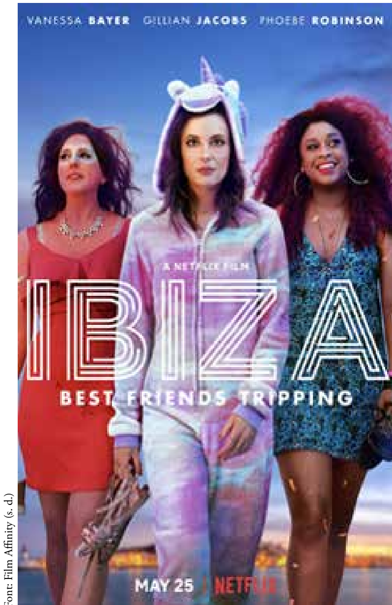
Figura 2. Les illeïtats de referència dins les societats contemporànies